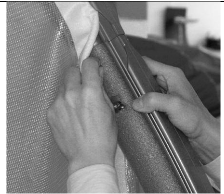
Abbildung 6a bis 6c

7.a) Entfalten Sie das Bodenteil und legen Sie es so auf den Boden, dass der Schlitz mit den Klettverschlüssen zu sehen ist. Klettverschlüsse öffnen. Die Isierelemente nun in das Bodenteil einlegen.