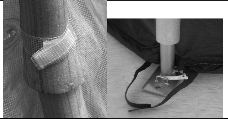
Abbildung 8 und 9

10.) Sie können nun die Boden-Reißverschlüsse schließen.