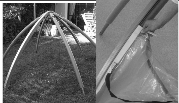
Abbildung 2 und Abbildung 3